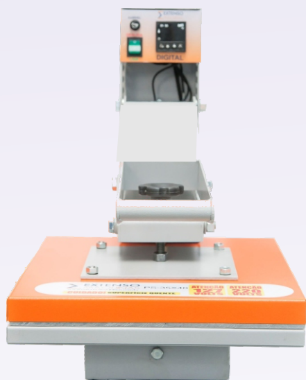
Sublimação e Transfer

Saiba qual modelo é mais adequado para o seu tipo de negócio!