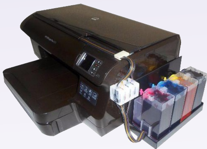
Jato de Tinta